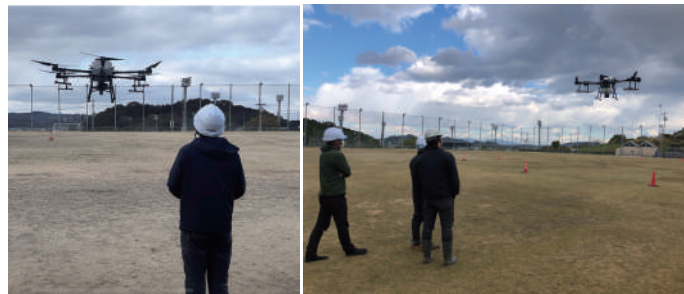
教習プログラム一覧

ドローン防除のプロが教えるドローン教習・整備場 農業用ドローンの知識や操縦技術を学ぶだけでなく購入～アフターメンテナンスまですべてをトータルサポートしますのでご安心ください。