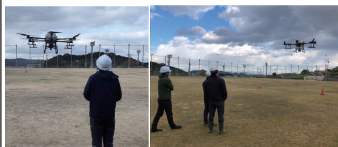
教習プログラム一覧